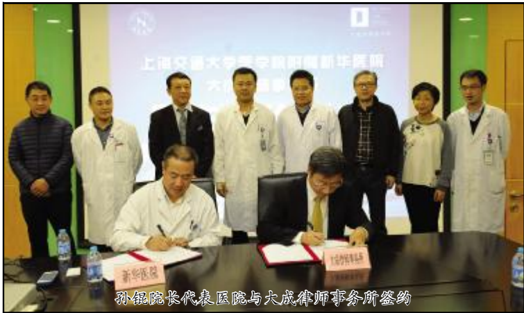
孙锺院长代表医院与大成律师事务所签约